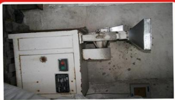
老中药厂中药材粉碎机