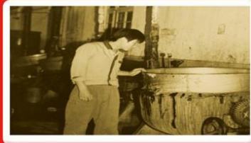
1984年老中药厂的浓缩锅