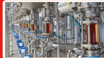
现代中药数字化提取精制工厂萃取塔