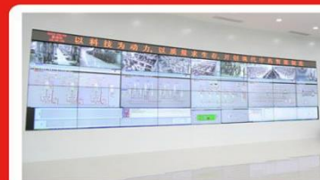
现代中药数字化提取精制工厂中控室