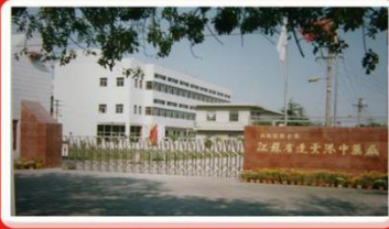
连云港中药厂大门